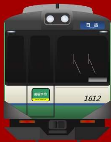
NAKASENDO / SUGAMO-NAKASENDO LINE