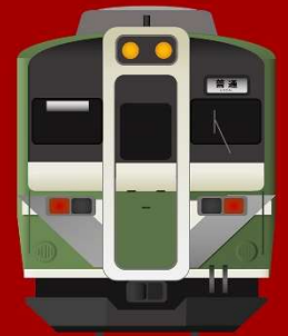
OBU MAIN LINE