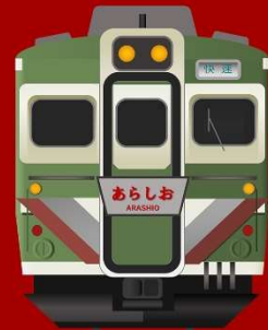
NIGHT TRAIN ARASHIO