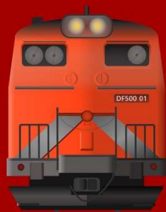
BANGAN / GAN-U LINE